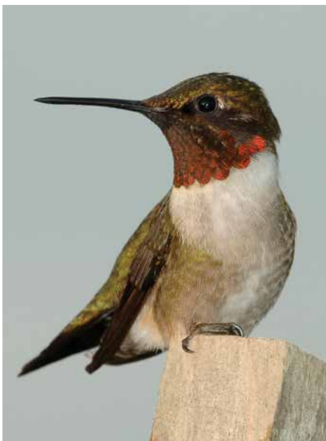
Colibrí de garganta rubí ( Archilochus colubris ), que se reproduce en áreas templadas del este de los Estados Unidos y Canadá, y pasa el invierno boreal en el trópico.