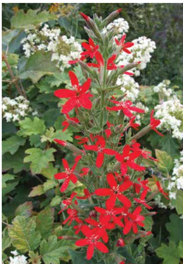
Royal catchfly (atrapamoscas real), planta perenne ( Silene regia ) nativa de los pastizales norteamericanos polinizada por el picaflor de garganta rubí.