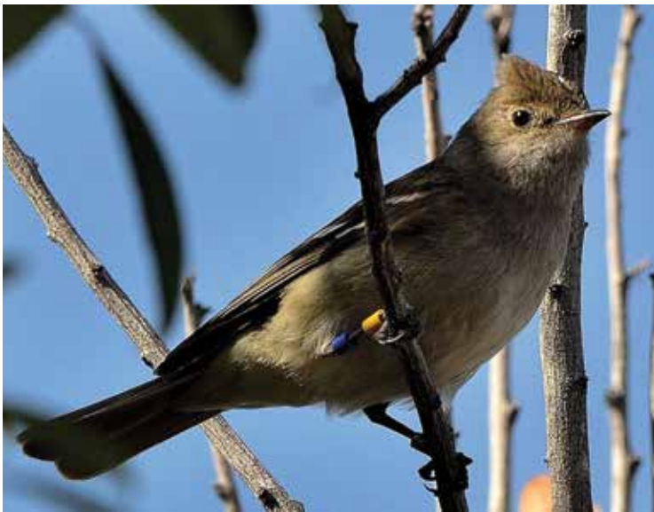
Fiofío silbón ( Elaenia albiceps ), que se reproduce en los bosques andino-patagónicos y migra a zonas tropicales para pasar el invierno. En una de sus patas se advierten anillos cuyos colores permiten identificar a individuos en el campo.

y actuar de vectores pasivos de esas enfermedades entre países y aun continentes. Para predecir adónde podrían transportar enfermedades, se necesita estudiar cuáles especies podrían hacerlo, entre qué puntos migran y sus rutas de viaje.