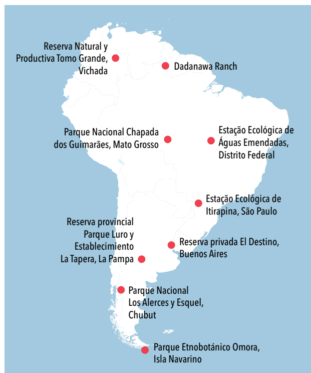
Sitios en que la Red Aves Internacionales estudia las aves migratorias.

Las aves migratorias también pueden ser portadoras de enfermedades. Pueden constituir reservorios de virus, como los de influenza aviar, encefalitis equina y otros,