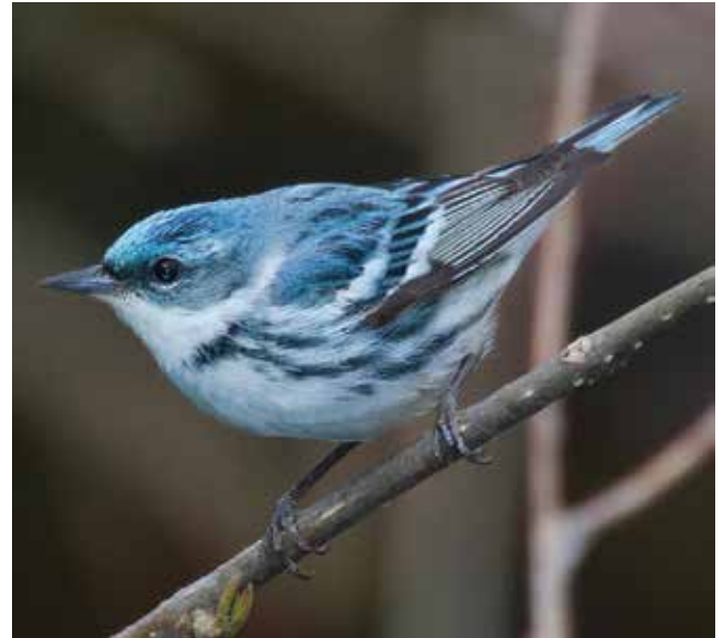
Reinita cerúlea ( Setophaga cerulea ), que entre mayo y julio nidifica en los bosques caducifolios del este norteamericano y pasa el invierno boreal en Centroamérica y el norte de Sudamérica.

El estudio de estas migraciones proporciona una mayor apreciación del mundo natural y brinda información para la conservación de la naturaleza y el cuidado de la salud humana. Entre otras cosas, hemos aprendido que las poblaciones de varias especies de aves migratorias están disminuyendo, entre ellas las de algunas de las regiones templadas norteamericanas que pasan el invierno en el trópico, como la reinita cerúlea ( Setophaga cerulea ), la cual nidifica en los bosques caducifolios del este de América del Norte entre mayo y julio, y pasa el invierno boreal en América Central y el norte de América del Sur. Su estudio durante todo el ciclo anual permitió establecer en qué época del año enfrenta los factores responsables de la abrupta disminución de sus poblaciones, que puede haber alcanzado el 70%. Pero se conoce muy poco sobre la situación de las poblaciones de similares migrantes en Sudamérica. Algunas especies podrían estar disminuyendo sin que lo sepamos y sin que hayamos investigado sus rutas migratorias, establecido dónde pasan el invierno y determinado si existen en esos lugares peligrosos para su supervivencia, por ejemplo, destrucción del hábitat, contaminación o caza ilegal.